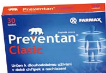
Preventan Klasik 30 tablet cena: 115 Kč