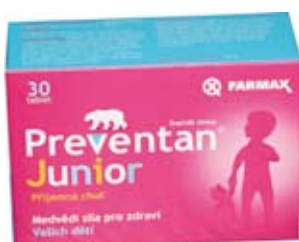
Preventan Junior 30 tablet cena: 125 Kč